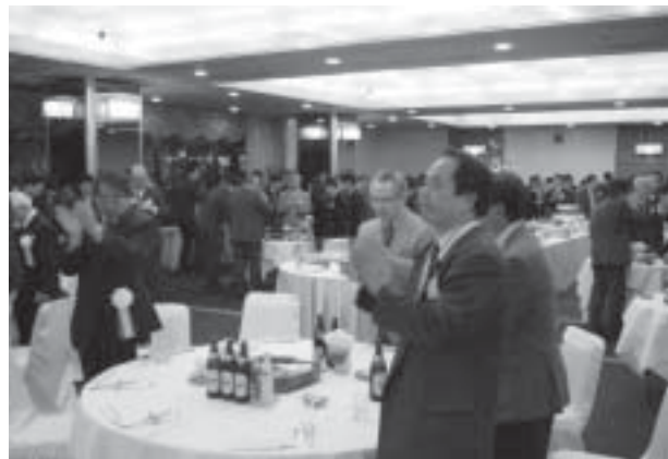
懇親会 (仙台ホテル)