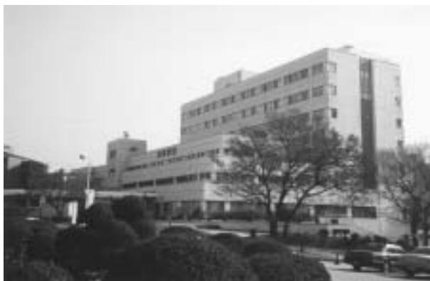
学会が開催されたソウル大学歯学部病院

学会前日の12日に関西空港よりソウルに入りましたが、飛行時間は約2時間で、改めて最も日本から近い国であることを実感致しました。気温は大阪よりかなり低く、0 近くで風が吹くとwind chillでより低く体感致しました。夜にはマイナス10 近くになっていたようです。ソウルはおりしも1週間後(12月19日)に大統領選挙を控えており、直接選挙のせいもあり、KDDR 役員の先生方もそれぞれの応援でにぎやかでありました。12日