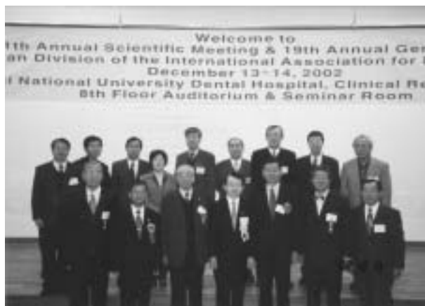
開会式後のKDDR 役員の先生方と著者

の夕方は宿泊先の Sofitel Ambassador ホテルの中華料理店でソウル大学歯学部長をはじめ歴代会長、役員の先生方が出席され盛大に歓迎していただきました。半数近くの先生方は英語を話されたり、時々流暢な日本語を話されるので少し戸惑いました。